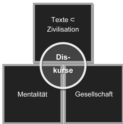
Abb. 1: Diskurse als Vereinigungsmenge aus Teilmengen der drei Kulturbereiche.

Allerdings erscheint der Diskursbegriff im ursprünglichen Sinn von Foucault zunächst als wenig geeignet, um in semiotische Kulturtheorien einbezogen zu werden. Er lässt sich jedoch mit semiotischen Mitteln in einem semiotischen Kulturmodell explizieren. Dafür greifen wir auf die Hypothese zurück, dass Diskurse den Zusammenhang zwischen Texten, Mentalität und Gesellschaft herstellen (vgl. Siefkes 2013: 361 [These 5]). Die Darstellung in Abb. 1 stellt eine erste Annäherung an diese Hypothese dar, indem sie Diskurse als übergreifenden Bereich visualisiert, der sich aus Teilen der drei Kulturbereiche zusammensetzt.